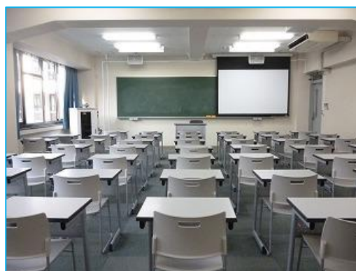
図 8 10号館1階 AV ラック型教室