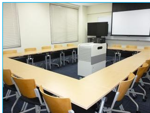
図 6 6号館大型ディスプレイ型教室