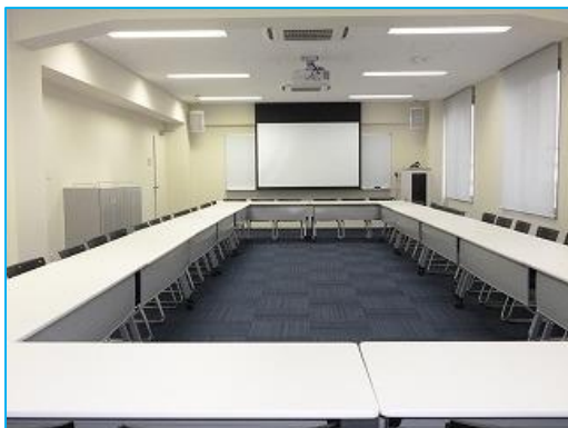
図 5 6号館 AV ラック型教室