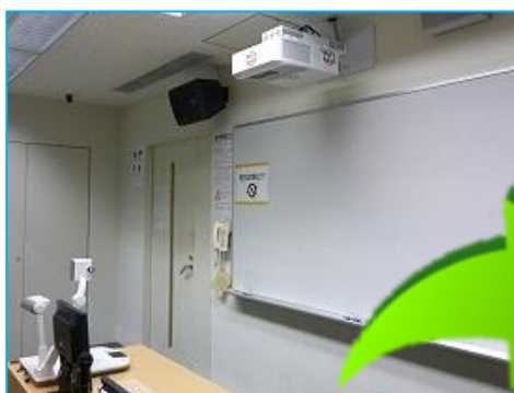
図 3 8 号館 PC 教室