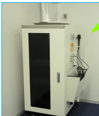
図 1 7 号館 AV ラック