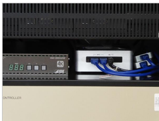
図 17: miniMediasite