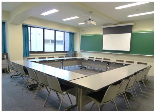
図 12:5308 教室