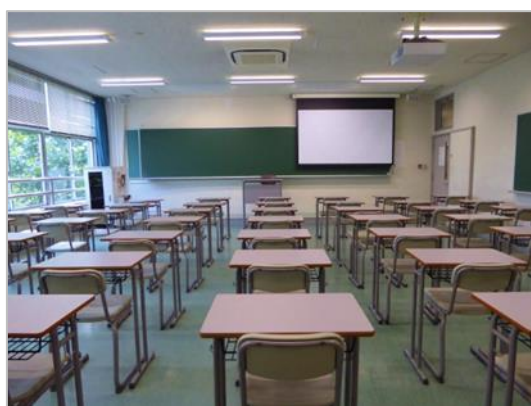
図 8 : X308 教室