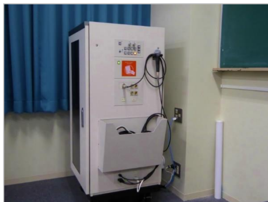
図 9 : AV ラック