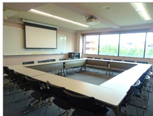
図 13:9403 教室