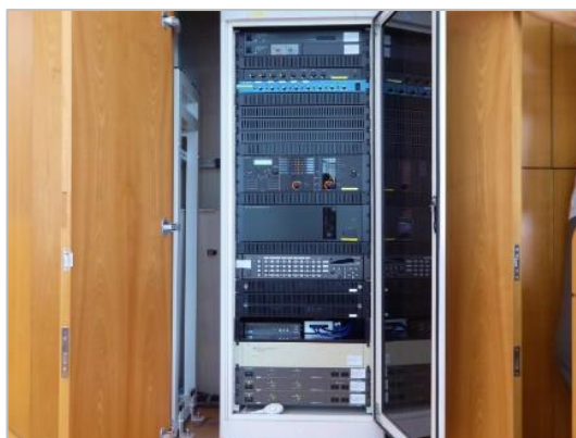
図 16: 機器ラック (D301 教室)