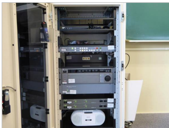
図 10:AV ラック内部