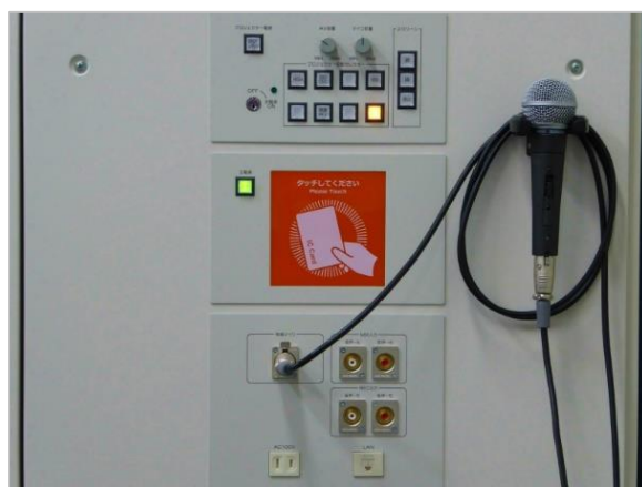
図 11:AV ラックパネル