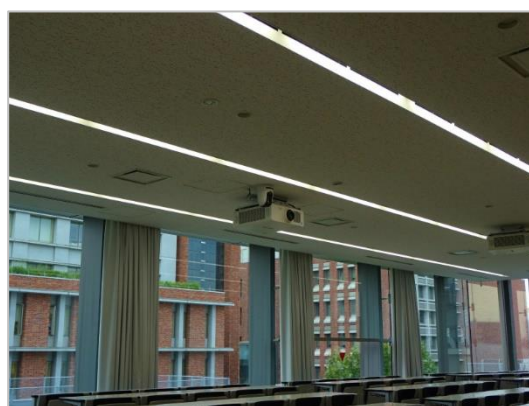
図 18: 天吊りリモートカメラ