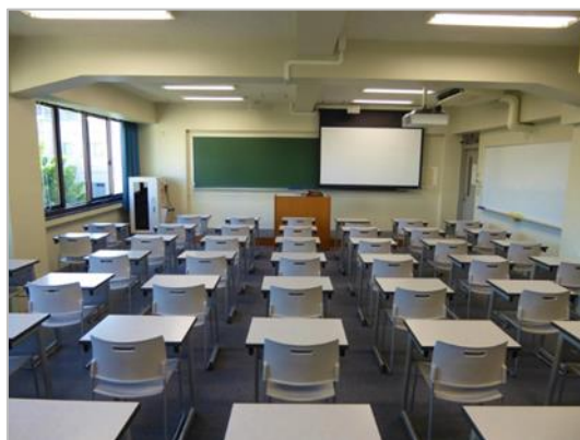
図 7 : 5501 教室