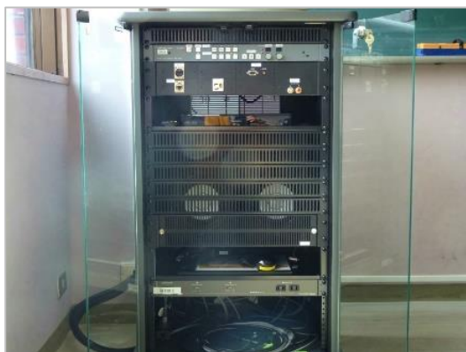
図 14:S ラック