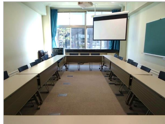
図 15:X108 教室