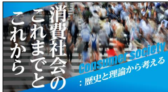
図1：JMOOC 講座コースカード