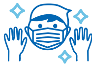
清掃作業時の マスク・手袋の着用徹底