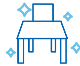
椅子・テーブルの 消毒徹底