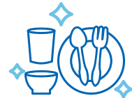
食器・トレー・しゃもじ等の 消毒強化・徹底