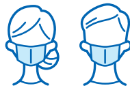
業務対応時のマスク着用