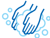
手洗い、うがい、消毒の徹底