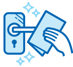
手に触れる箇所の消毒徹底 ※ドアノブ、エレベーター等