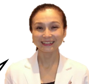
新宿追分クリニック 管理栄養士

講師紹介： 栄養管理や病態の栄養指導、集団栄養指導、病院食の献立づくりなど、病院の臨床現場にて10年以上のキャリアがある。現在は新宿追分クリニックで、検査値から読み取れる生活習慣や食習慣を基軸に栄養指導を実施。また、『食べることの大切さ』を意識した、栄養や食について、より個別的な多面的アプローチを展開中。