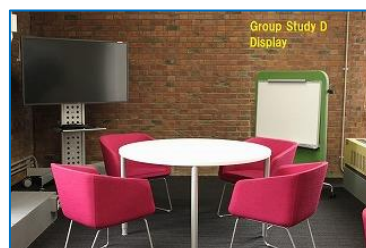
図 8 グループ学習 D