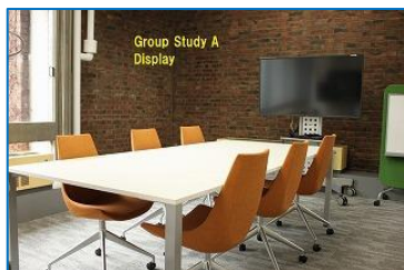
図 2 グループ学習 A