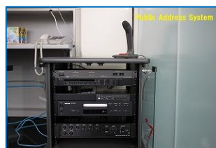
図 1 受付カウンター