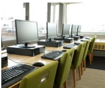
図 10 カウンター席 デスクトップ PC