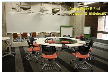
図 4 グループ学習 B 東側プロジェクター