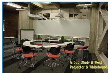
図 5 グループ学習 B 西側プロジェクター