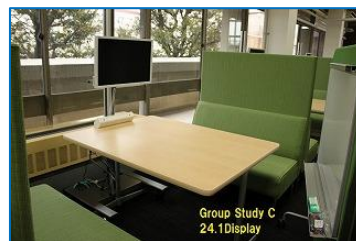
図 7 グループ学習 C