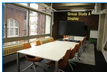
図 3 グループ学習 A