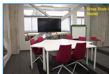
図 15 グループ学習 I