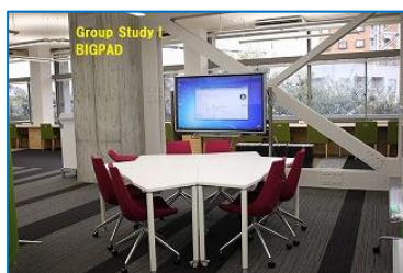
図 14 グループ学習 I