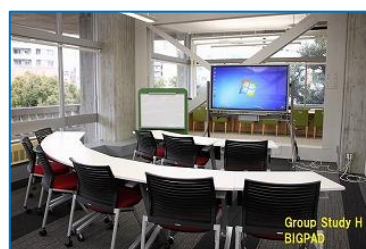
図 13 グループ学習 H