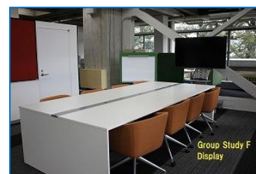
図 9 グループ学習 E