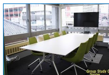
図 11 グループ学習 G