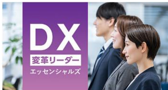
図2：講座②コースカード

※本講座はビジネスデザイン研究所による文部科学省委託事業（「DX 等成長分野を中心とした就職・転職支援のためのリカレント教育推進事業」）「DX 変革リーダー育成プログラム」の一環で開講されたものである。