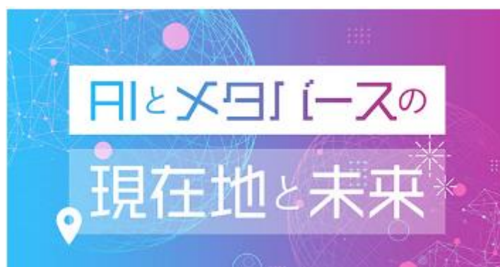
図 1：講座①コースカード