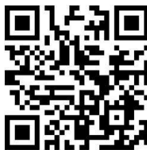
【セントポールズ・アクアティックセンター】