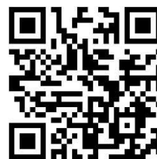
【セントポールズ・アクアティックセンター】