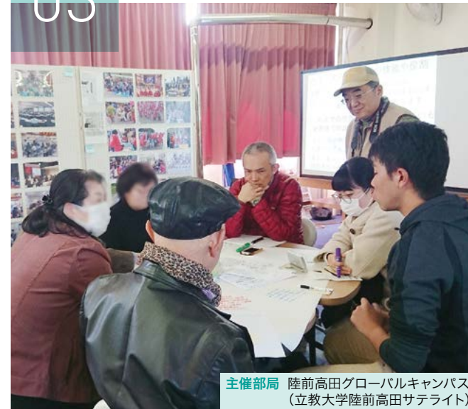
主催部局 陸前高田グローバルキャンパス (立教大学陸前高田サテライト)