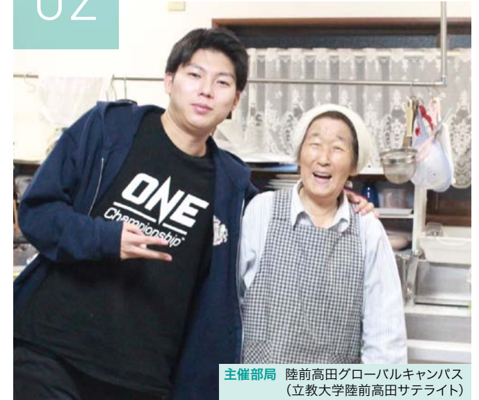
主催部局 陸前高田グローバルキャンパス (立教大学陸前高田サテライト)

陸前高田グローバルキャンパスを共同運営している岩手大学と協力して行うプログラムです。陸前高田市が力を入れている「民泊」は、復興に向けて歩む人々の意識や生活、地域の歴史や伝統など、多くの「生」の情報に触れることのできる体験です。民泊体験などのフィールドワークを通し、他大学の学生とも交流しながら、日本の地域社会、特に震災を経験した地域で人々が日々紡いでいる生活に触れ、そのリアリティを感じ取る体験は、視野を広げ、その後の学びにも活かし得るものとなるでしょう。